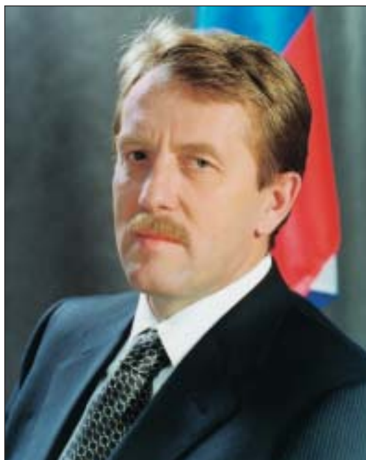
Гордеев Алексей Васильевич Заместитель Председателя Правительства России Министр сельского хозяйства Председатель Наблюдательного совета ОАО «Россельхозбанк»

«Без малого двести лет насчитывает история создания и существования в нашей стране национальной кредитно-финансовой системы в аграрной сфере экономики. Летели годы, шли десятилетия, два века успели сменить друг друга, но одно оставалось неизменным – у нашего крестьянина всегда были надежные финансовые тылы. Российский Сельскохозяйственный банк, созданный в 2000 году государством для кредитования предприятий агропромышленного комплекса Российской Федерации, принял эстафету у своих предшественников, и, я уверен, с честью будет нести высокое звание народного крестьянского банка».