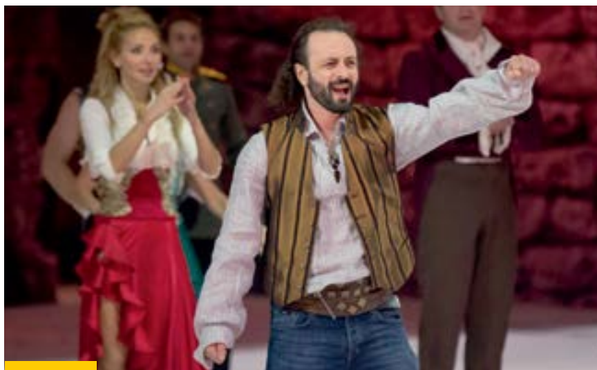
Прошло шесть лет, прежде чем я пришел к «Кармен». Это произведение, которое имеет очень крепкую драматургическую основу

— Это сложно объяснить. На самом деле, это была далеко не первая идея после «Огней...». Если честно, я, как любой творческий человек, всегда хочу придумать что-то исключительно свое. И мы потратили очень много времени на написание собственного сценария для льда, но мне ничего не нравилось, потому что во всем был повтор сюжетов. Время поджигало, и я понял, что нужно взять классическое произведение, на которое можно опереться, и уже внутри него найти разные грани. И тогда пришел образ Кармен, во-первых, как произведение, которое имеет очень крепкую драматургическую основу, во-вторых, если бы у нас не получилось