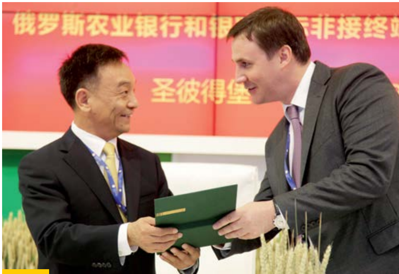
Президент China UnionPay Co., Ltd. Ши Вэньчао и Председатель Правления АО «Россельхозбанк» Дмитрий Патрушев