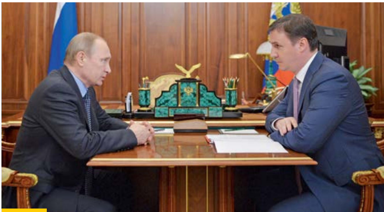
Президент Российской Федерации Владимир Путин и Председатель Правления АО «Россельхозбанк» Дмитрий Патрушев