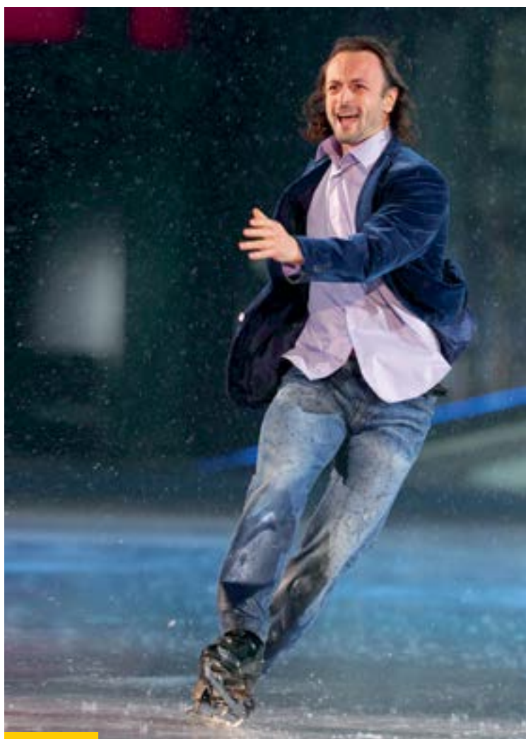
Илья Авербух — чемпион России, серебряный призер Олимпийских игр. В настоящее время является продюсером собственных ледовых шоу

— Удачи Вам в исполнении всего задуманного!