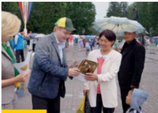
Специалисты отдела продаж Горно-Алтайского филиала провели промоакцию для гостей праздника «Эл-Ойын»

Министр сельского хозяйства России Александр Ткачев и министр промышленности и торговли Российской Федерации Денис Мантуров приняли совместное решение о возобновлении проведения Всероссийского дня поля. Основной площадкой мероприятия стала житница не только Сибири, но и всей страны — Алтайский край. В регионе создана крупнейшая современная база для демонстрации сельскохозяйственной техники и передовых аграрных технологий. По оценкам экспертов, Сибирский агропарк — одна из крупнейших в России выставочных площадок.