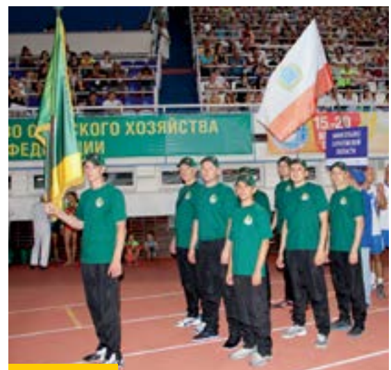
Торжественное открытие XI Всероссийских летних сельских спортивных игр на центральном стадионе «Локомотив» г. Саратова