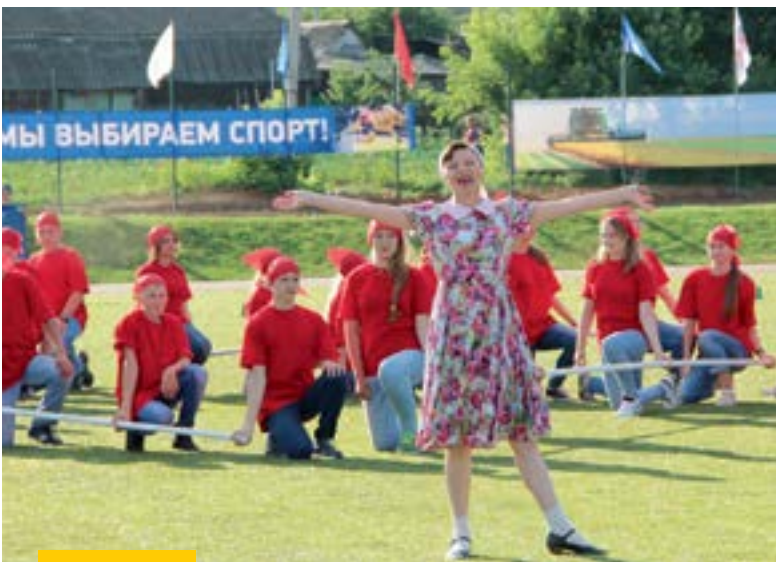
Церемония открытия XXV Республиканских летних сельских спортивных игр в Удмуртии