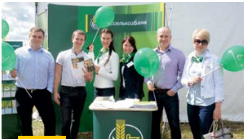
Сотрудники отдела малого и микробизнеса Тульского филиала к работе в полевых условиях готовы!

ВОЗРОЖДЕННЫЙ ВСЕРОССИЙСКИЙ ДЕНЬ ПОЛЯ И СЕЛЬСКИЕ СПОРТИВНЫЕ ИГРЫ — ДВА МАСШТАБНЫХ ПРОЕКТА, НА КОТОРЫХ БЫЛИ СФОКУСИРОВАНЫ ВЗГЛЯДЫ ПРЕДСТАВИТЕЛЕЙ КРЕСТЬЯНСТВА ИЗ РАЗНЫХ РЕГИОНОВ СТРАНЫ ЛЕТОМ 2016 ГОДА. РОССЕЛЬХОЗБАНК И ЖУРНАЛ «СЕЛЬСКИЙ ХОЗЯИНЪ» ПОБЫВАЛИ НА МЕСТАХ, ГДЕ РАЗВЕРНУЛИСЬ САМЫЕ ИНТЕРЕСНЫЕ СОБЫТИЯ УХОДЯЩЕГО СЕЗОНА.