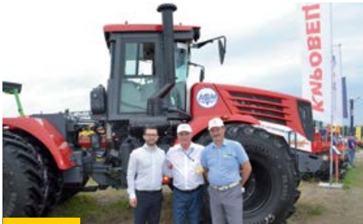
Фермеры Алтайского края с интересом знакомились с кредитными программами банка