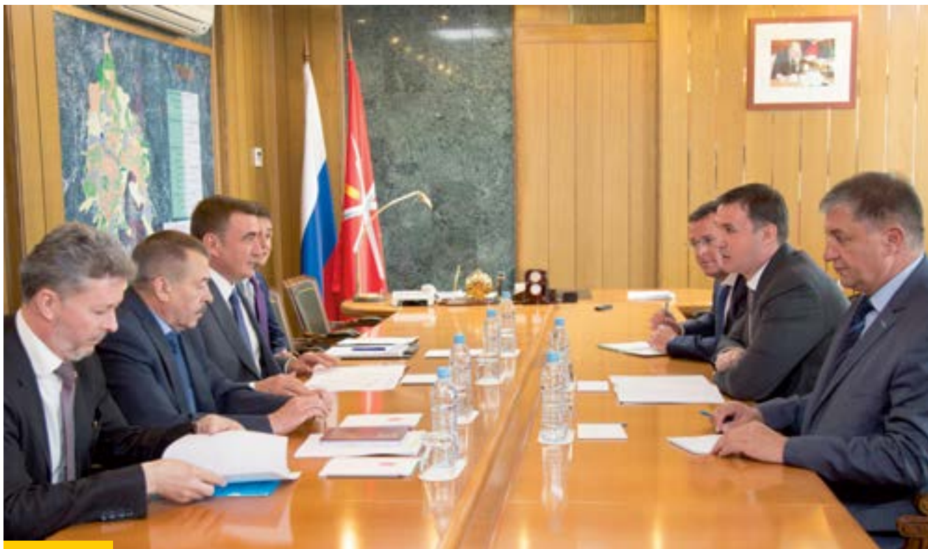
Рабочая встреча Председателя Правления АО «Россельхозбанк» Дмитрия Патрушева с и.о. губернатора Тульской области Алексеем Дюминым