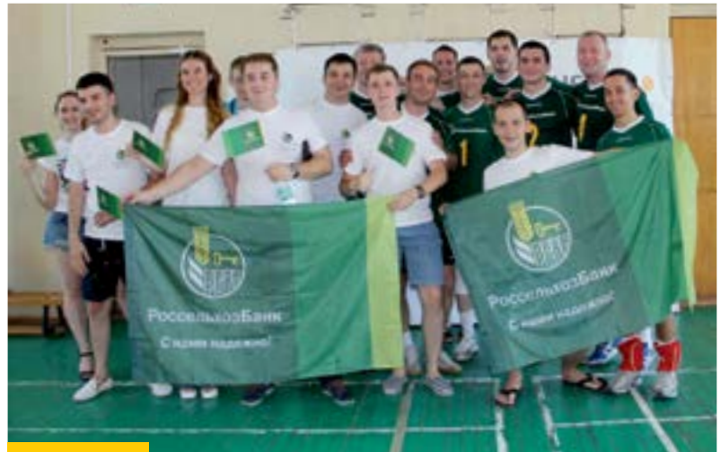
Сборная команда Саратовского филиала по волейболу приняла участие в XI Всероссийских летних сельских спортивных играх

Сельское физкультурно-спортивное движение зародилось в середине 30-х годов XX века. Сейчас к нему примкнули миллионы представителей российского АПК. Первые Всероссийские летние спортивные игры прошли в 1995 году в Волгоградской области. Тогда это событие было приурочено к 50-летию Победы в Великой Отечественной войне. С тех пор проведение сельских игр стало традиционным. Помимо спортивных дисциплин, в рамках сельских игр проводятся и состязания профессионалов. Демонстрируя свое мастерство, доярки, косари и механизаторы отстаивают честь регионов и поднимают престиж сельских профессий. В этом году в соревнованиях приняли участие 2097 спортсменов из 67 регионов страны.