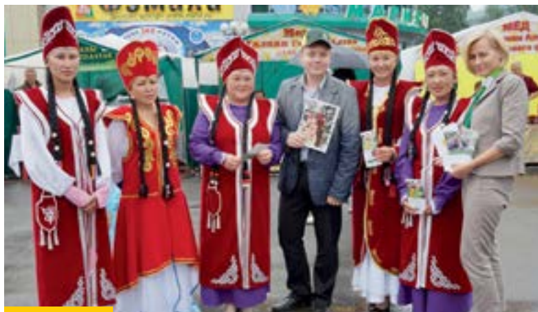
В честь главного праздника аграриев «Эл-Ойын» творческие коллективы Горно-Алтайской Республики порадовали гостей своими номерами с песнями и танцами