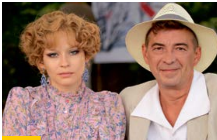
С актером Николаем Добрыниным на съемочной площадке многосерийного фильма «Людмила Гурченко»