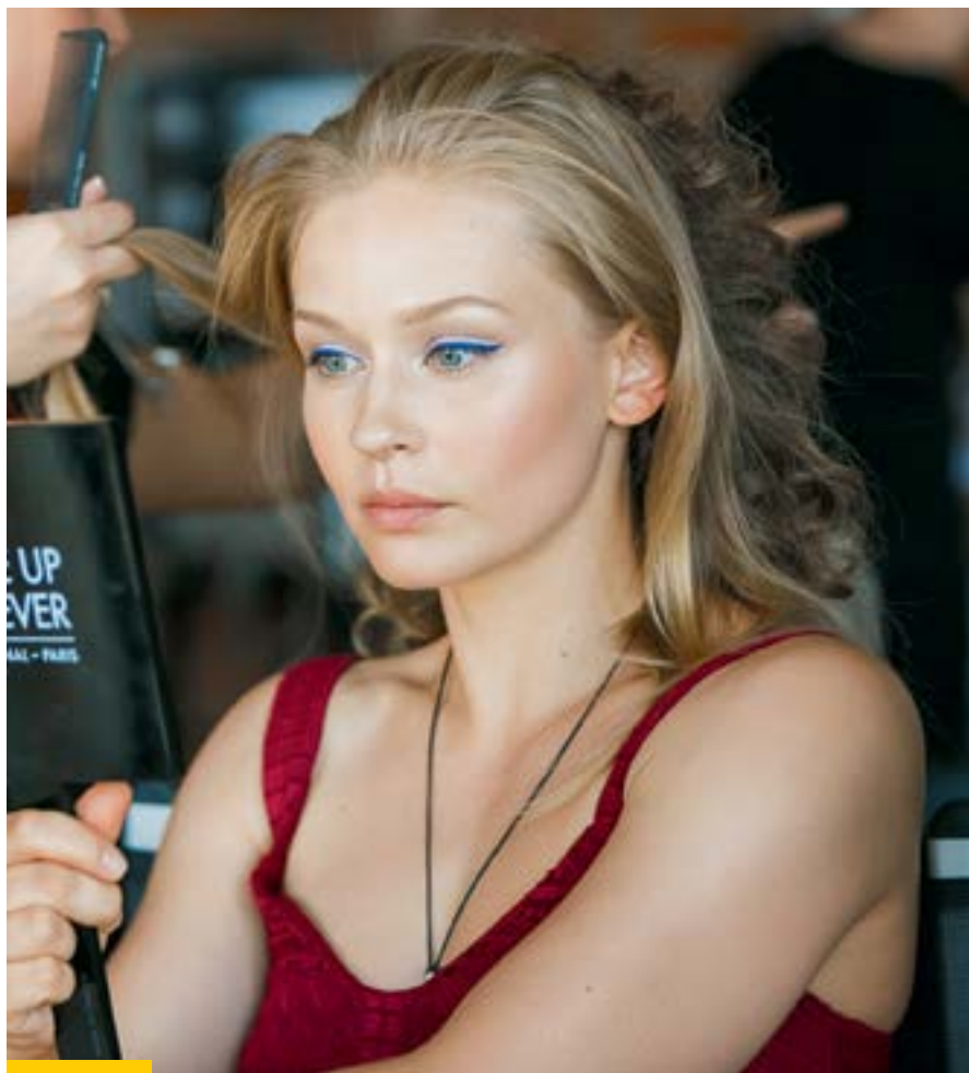
Сила духа и женственность — черты, которые приковывают внимание к Юлии Пересильд на экране, на сцене и в жизни

— Про таких, как я, говорят: «шпана»! Я хулиганила, но не причиняла родителям никаких хлопот, была удобным ребенком. Мои дети совершенно другие. Они требуют внимания и делают это на-