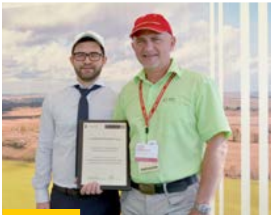
Представитель Алтайского филиала банка вручает отличительный знак «Надежный клиент 2015 года»