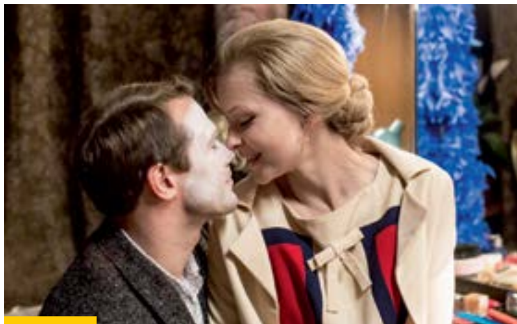
Юлия Пересильд (Ралисса) и Алексей Морозов (Василий Аксенов) в сцене из нового сериала Дениса Евстигнеева «Таинственная страсть»

— Я очень люблю красивые платья. Особенно старые, винтажные. Если удастся попасть на какой-то блошинный рынок и найти что-то такое интересное, меня это очень радует. И я «парфюмерный маньяк», без ума от ароматов. Причем выискиваю редкие, уникальные духи, мне их привозят, достают где-то. Это, конечно, недорогое удовольствие, но я считаю, что аромат должен быть даже дороже, чем платье. Есть малоизвестные французские заводишки, которые производят духи с какими-то совершенно нереальными запахами. Я все носом чую — эмоции, события, людей.