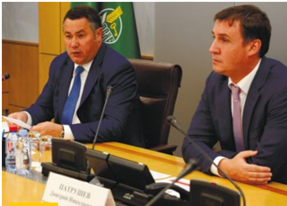
Губернатор Тверской области Игорь Руденя и Председатель Правления АО «Россельхозбанк» Дмитрий Патрушев на встрече потенциальных инвесторов с руководством Тверской области

ПРЕДСТАВИТЕЛИ РОССЕЛЬХОЗБАНКА ВЫРАЗИЛИ ГОТОВНОСТЬ ОКАЗЫВАТЬ КРЕДИТНУЮ ПОДДЕРЖКУ ПЕРСПЕКТИВНЫМ ПРОЕКТАМ В РЕГИОНЕ, РАЗВИВАТЬ СОТРУДНИЧЕСТВО С ПРЕДПРИЯТИЯМИ МАЛОГО И СРЕДНЕГО БИЗНЕСА ИЗ РАЗЛИЧНЫХ ОТРАСЛЕЙ ЭКОНОМИКИ.