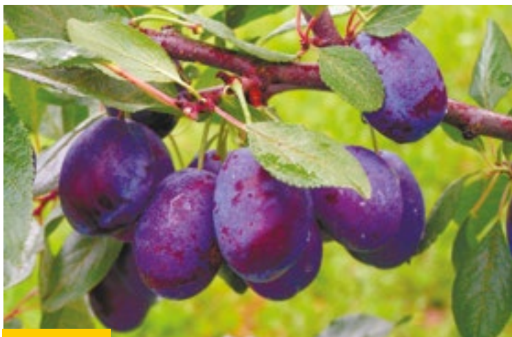
Щедрая природа Дагестана вдохновляет технологов Кикунинского завода на создание новых рецептов

ВСЯ ПРОДУКЦИЯ ООО «КИКУНИНСКИЙ КОНСЕРВНЫЙ ЗАВОД» ПРОИЗВОДИТСЯ НА ГОРНОЙ РОДНИКОВОЙ ВОДЕ И ОБЛАДАЕТ ВЫСОКИМИ ВКУСОВЫМИ КАЧЕСТВАМИ.