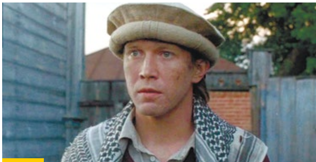
За главную роль в фильме «Мусульманин» (1995 г.) Евгений Миронов был награжден Орденом духовного управления мусульман России