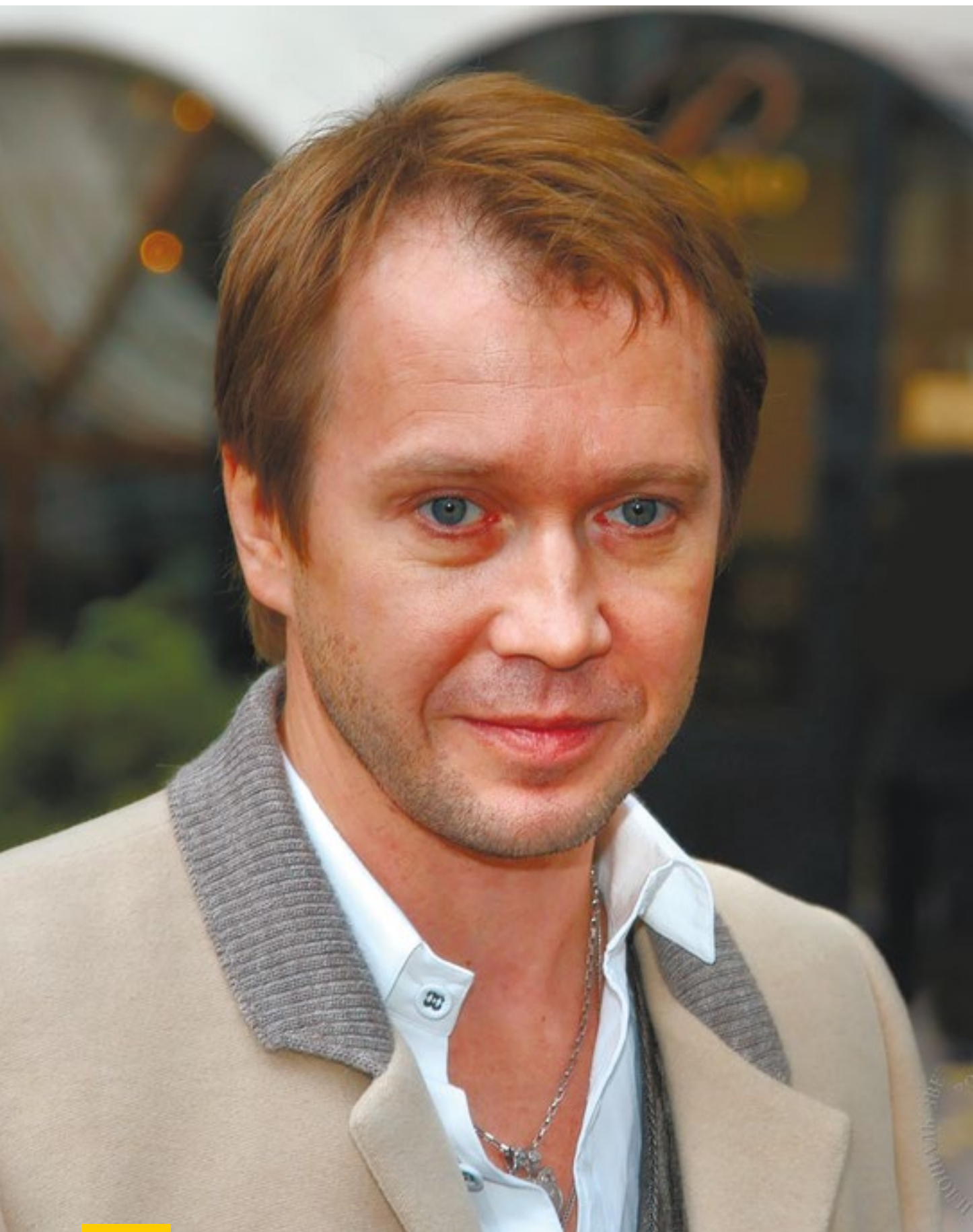
Уроженец города Саратова, народный артист России Евгений Миронов свой юбилей планирует встретить на родной земле