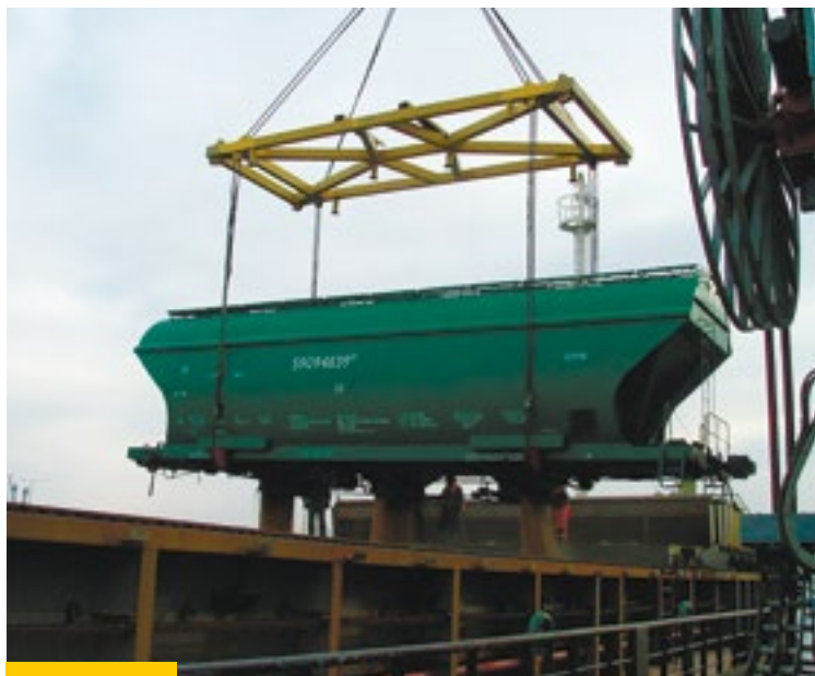
Один из крупнейших в стране экспортеров зерна — ООО «Амурзерно» — является также официальным поставщиком продукции для государственных нужд России

СПЕЦИФИКА РЕГИОНОВ, ГДЕ МЫ ПРОИЗВОДИМ ЗАКУПКУ ЗЕРНОВЫХ, КАК РАЗ В ТОМ, ЧТО СОВОКУПНОСТЬ ТЕХНОЛОГИЧЕСКИХ, АГРОКЛИМАТИЧЕСКИХ И ЭКОЛОГИЧЕСКИХ ФАКТОРОВ ПОЗВОЛЯЕТ ПОЛУЧАТЬ КАЧЕСТВЕННОЕ ЗЕРНО БЕЗ ЕГО ПОСЛЕДУЮЩЕЙ ПОДРАБОТКИ.