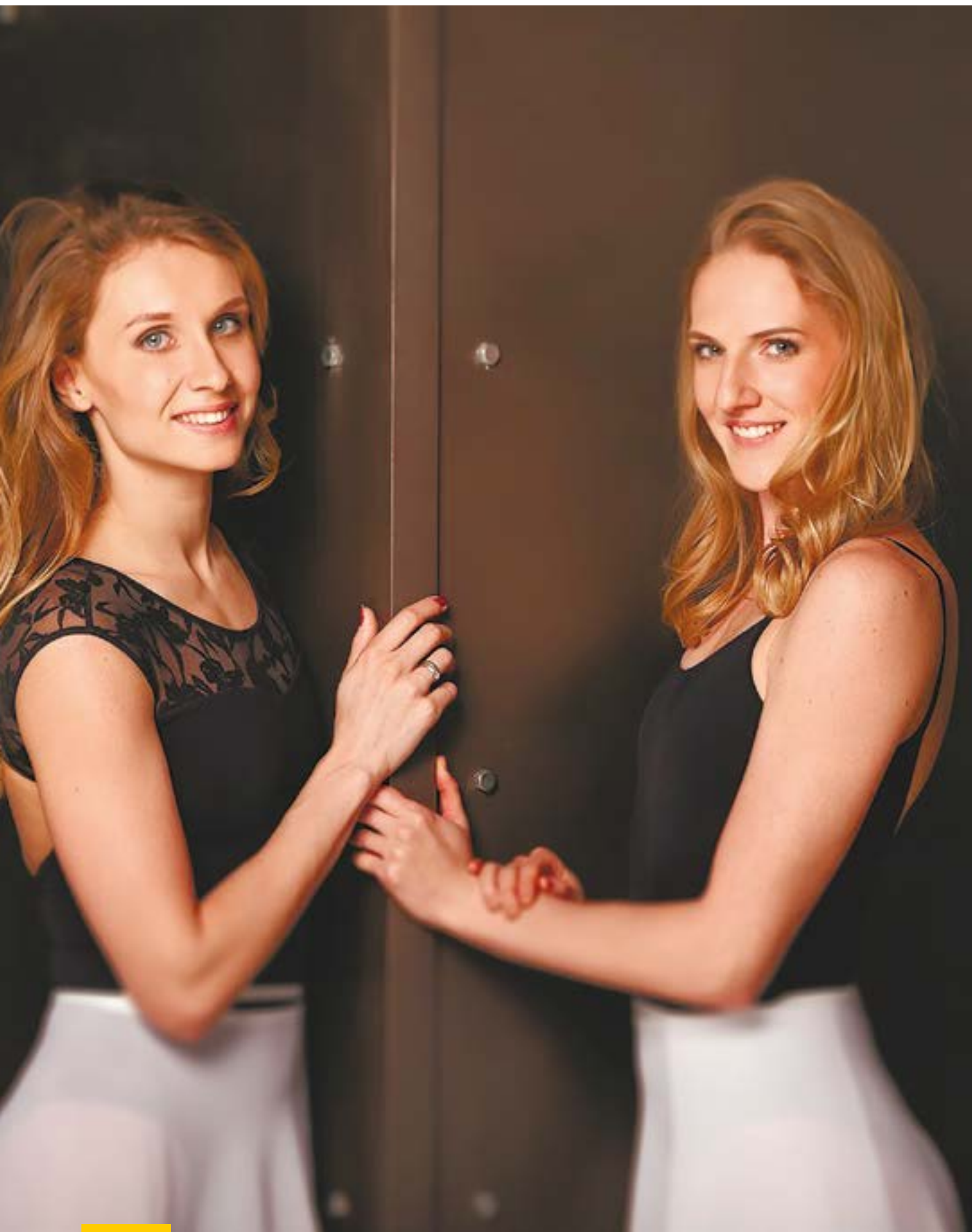
Пятикратных олимпийских чемпионки по синхронному плаванию Наталью Ищенко (слева) и Светлану Ромашину объединяет несгибаемая вера в победу