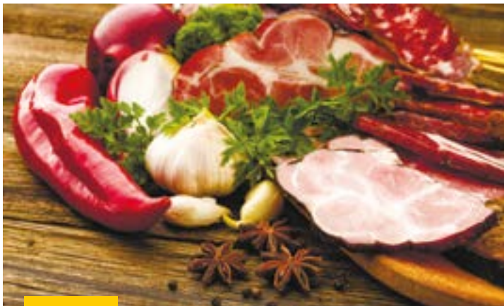
Бренд «Равис — птицефабрика Сосновская» — это более 200 наименований продукции, отвечающей самым высоким требованиям покупателей

Практически каждая вторая тушка, покупаемая в Челябинской области — «Равис». Под маркой «Равис» выпускается более 200 наименований продукции, отвечающей самым высоким стандартам. Наряду с традиционным ассортиментом — цыпленок-бройлер, полуфабрикаты и субпродукты — предприятие производит колбасные изделия и копченые деликатесы, кулинарные полуфабрикаты, а также уникальную продукцию «халяль». Помимо мяса птицы, сегодня «Равис» активно занимается выращиванием зерновых и овощных культур, а также осваивает производство молока, говядины и свинины. Философия предприятия — зарабатывать на обороте. Поэтому большая часть