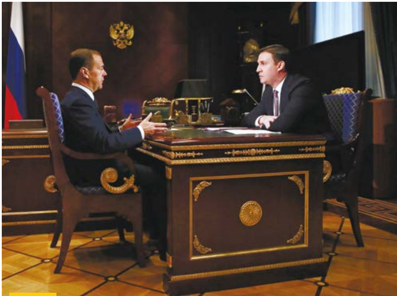
Председатель Правительства Российской Федерации Дмитрий Медведев и Председатель Правления АО «Россельхозбанк» Дмитрий Патрушев