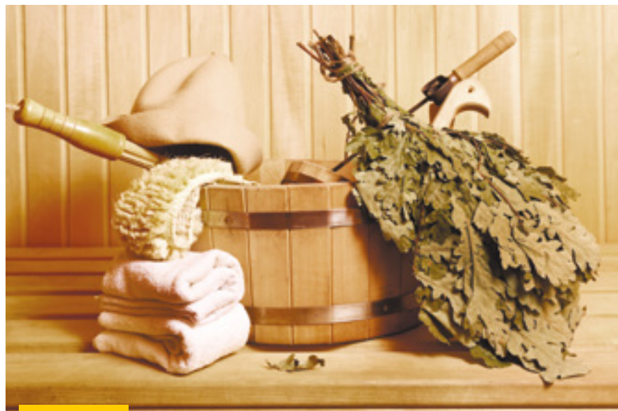
Баня, построенная на роднике, оказалась достойной альтернативой новомодным spa-комплексам, тем более что расположен банный комплекс практически в самом центре России

В Визимбири любители активного отдыха могут попробовать себя в роли крестьянина и испытать на выносливость и прочность — принять участие в сельскохозяйственных работах. Колка дров, сбор и заготовка грибов, ягод и душистых трав, купание в ледяных купелях, рыбалка и, конечно же, русская и марийская бани, в том числе и «по-черному», с березовыми вениками, никого не оставят равнодушным.