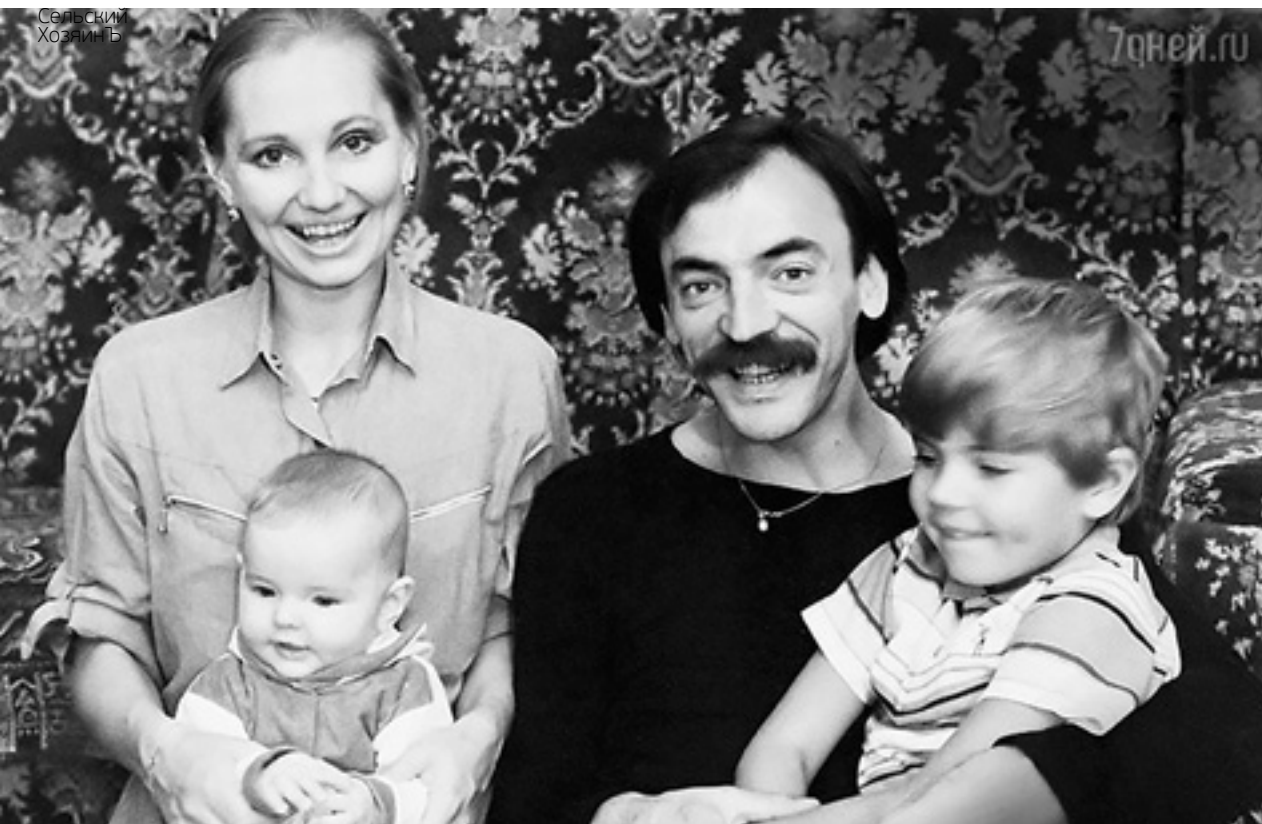
Михаил Боярский и Лариса Луппиан с детьми Лизой и Сережей, 1987 г.

ИНОГДА ДУМАЮ: «НАДО ВЫПЕНДРИТЬСЯ, НАДЕНУ ШИКАРНУЮ ЮБКУ, КАБЛУКИ». ПОТОМ ГЛЯНУ НА СЕБЯ В ЗЕРКАЛО И ВИЖУ, ЧТО ЭТО НЕ Я, А БЫТЬ ЕСТЕСТВЕННОЙ ДЛЯ МЕНЯ ГОРАЗДО ВАЖНЕЕ.