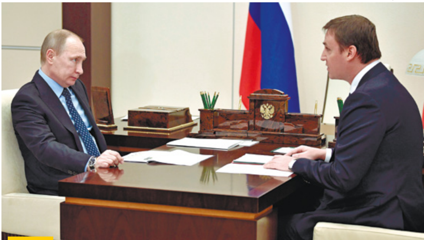
Президент Российской Федерации Владимир Путин и Председатель Правления АО «Россельхозбанк» Дмитрий Патрушев