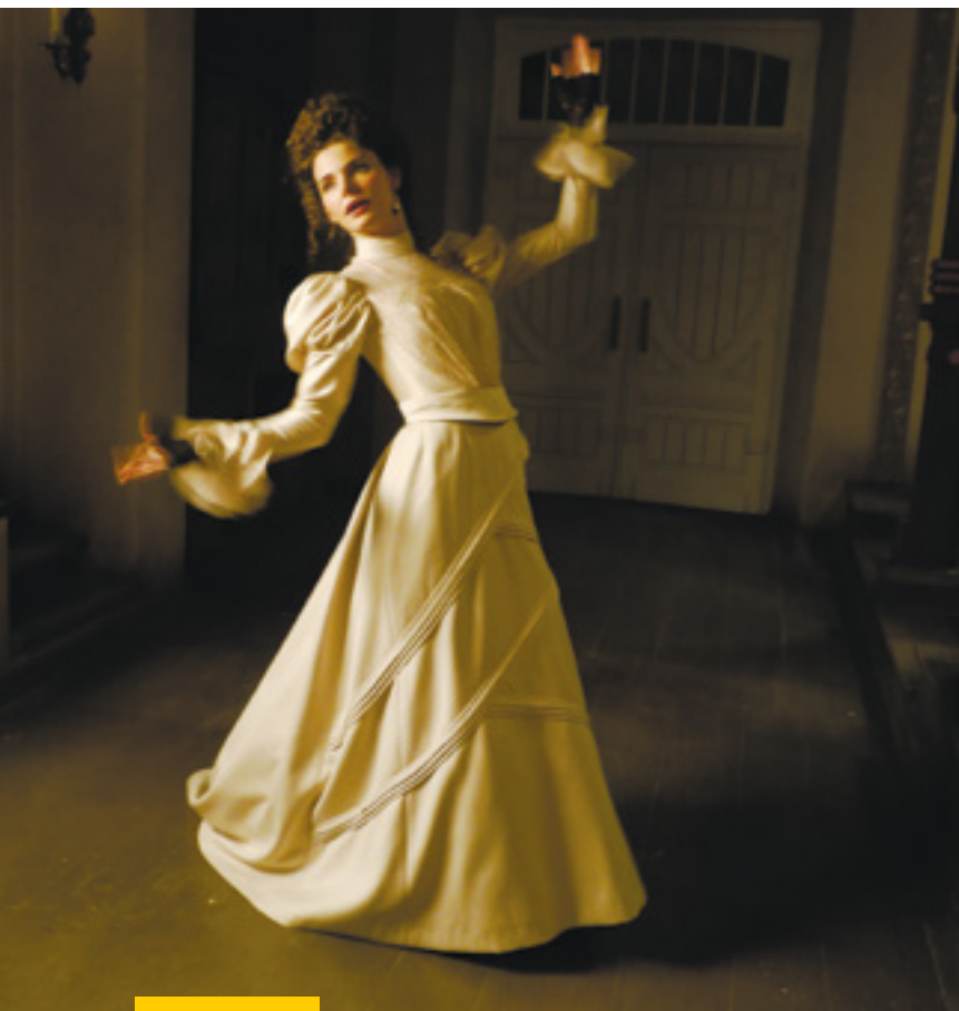
Кадр из биографического фильма «Куприн»