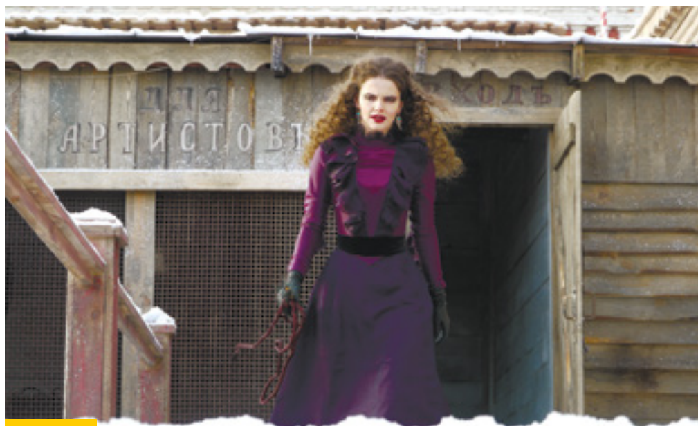
Со съемочной площадки биографического фильма «Куприн»