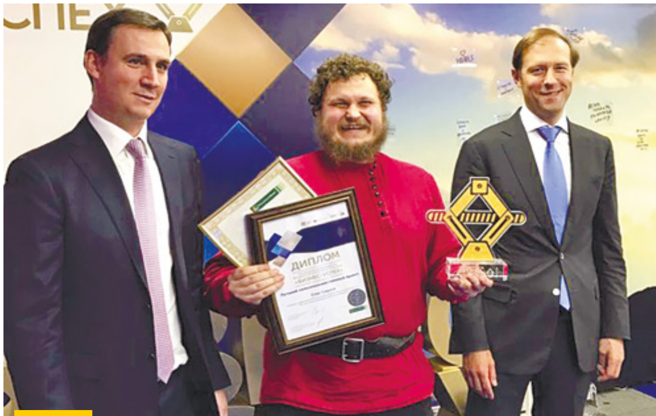
Председатель Правления АО «Россельхозбанк» Дмитрий Патрушев, фермер Олег Сирота и Министр промышленности и торговли РФ Денис Мантуров

ПРЕДСЕДАТЕЛЬ ПРАВЛЕНИЯ АО «РОССЕЛЬХОЗБАНК» ДМИТРИЙ ПАТРУШЕВ ВОШЕЛ В СОСТАВ ПОПЕЧИТЕЛЬСКОГО СОВЕТА НАЦИОНАЛЬНОЙ ПРЕМИИ «БИЗНЕС-УСПЕХ» — ОДНОЙ ИЗ ГЛАВНЫХ В РОССИИ НАГРАД В СФЕРЕ МАЛОГО И СРЕДНЕГО ПРЕДПРИНИМАТЕЛЬСТВА. ПРЕМИЯ, ОРГАНИЗОВАННАЯ «ОПОРОЙ РОССИИ», ОБЩЕСТВЕННОЙ ПАЛАТОЙ РОССИЙСКОЙ ФЕДЕРАЦИИ И АГЕНТСТВОМ СТРАТЕГИЧЕСКИХ ИНИЦИАТИВ, ЕЖЕГОДНО ВРУЧАЕТСЯ ЗА НАИБОЛЕЕ УСПЕШНЫЕ ПРОЕКТЫ В РАЗЛИЧНЫХ СЕГМЕНТАХ ЭКОНОМИКИ И ЛУЧШИЕ МУНИЦИПАЛЬНЫЕ ПРАКТИКИ ПОДДЕРЖКИ БИЗНЕСА.