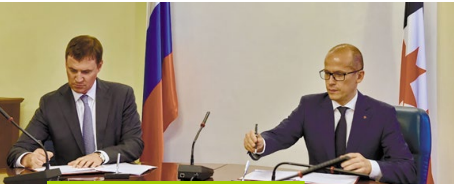
Председатель Правления АО «Россельхозбанк» Дмитрий Патрушев (слева) и врио Главы Удмуртии Александр Бречалов подписывают соглашение о сотрудничестве