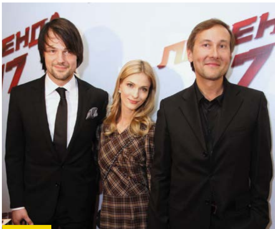
С актером Даниилом Козловским и режиссером Николаем Лебедевым на премьере фильма «Легенда № 17»

ЧЕСТНОСТЬ И ОТКРОВЕННОСТЬ СОБЕСЕДНИКА, ПАРТНЕРА, КОЛЛЕГУ, РЕЖИССЕРА ОБЕЗОРУЖИВАЮТ. ПРОСТОТА — ЭТО БОЛЬШАЯ СИЛА.