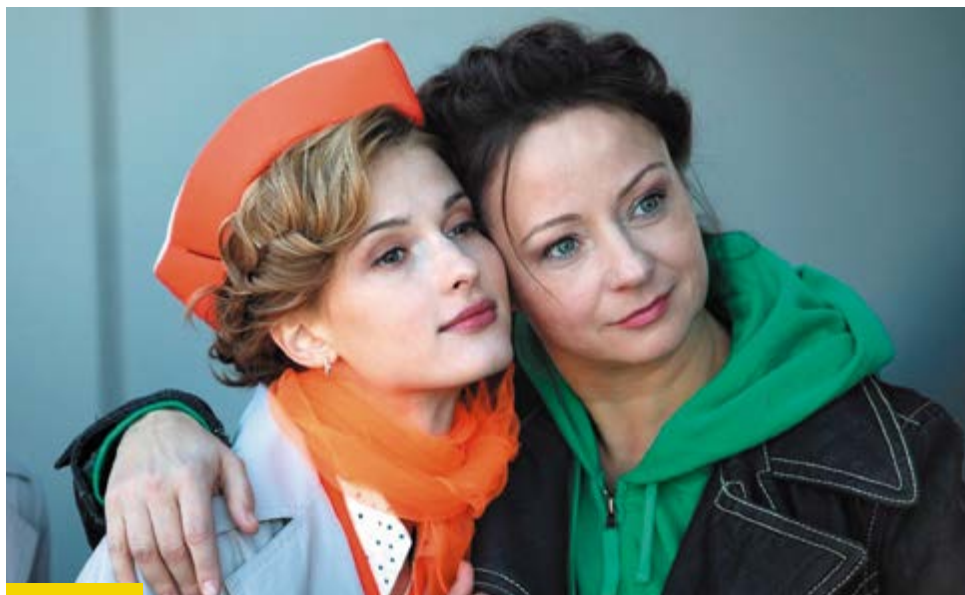
С актрисой Евгенией Добровольской на съемках комедии «Немного не в себе»