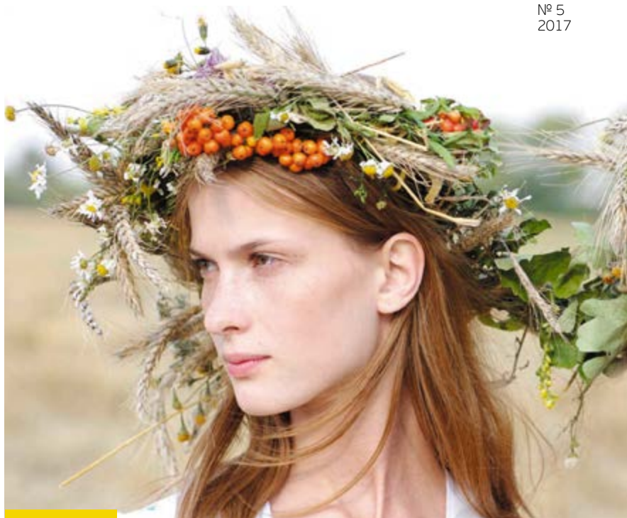
В роли Саши в драме Гарина Сукачева «Дом Солнца»

– Правильно сформулировать свои желания – это уже половина успеха. Потому что абстрактное «хочу быть богатой и знаменитой» – это не о чем, или «хочу быть артисткой» – хорошее желание, но надо понимать, чего ты конкретно ждешь. Хороший вопрос, я подумаю об этом перед Новым годом. (Улыбается.)