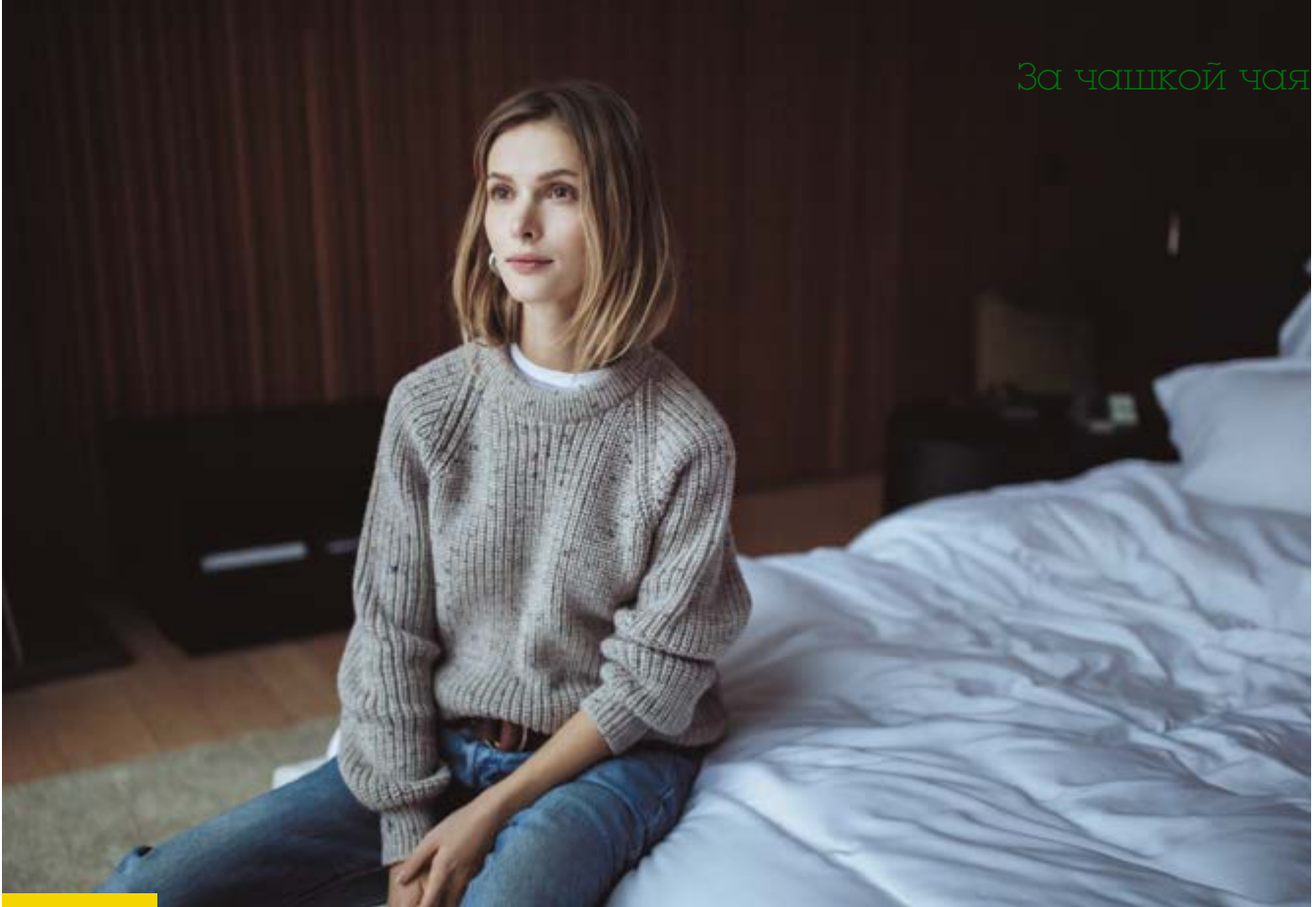
Элегантная и утонченная, Светлана Иванова одинаково убедительно выглядит в лирических и драматических образах

НЕСМОТРЯ НА ТО ЧТО Я ПОЧТИ НЕ КРАШУСЬ, СЧИТАЮ, ЧТО КОСМЕТИКА — ВЕЛИЧАЙШЕЕ ИЗОБРЕТЕНИЕ ЧЕЛОВЕЧЕСТВА, БЛАГОДАРЯ КОТОРОМУ МОЖНО НАРИСОВАТЬ СЕБЕ НАСТРОЕНИЕ.