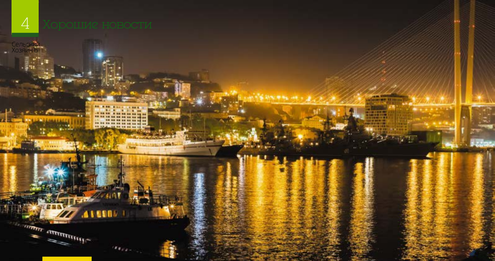
Мост через бухту Золотой Рог – одна из главных достопримечательностей Владивостока