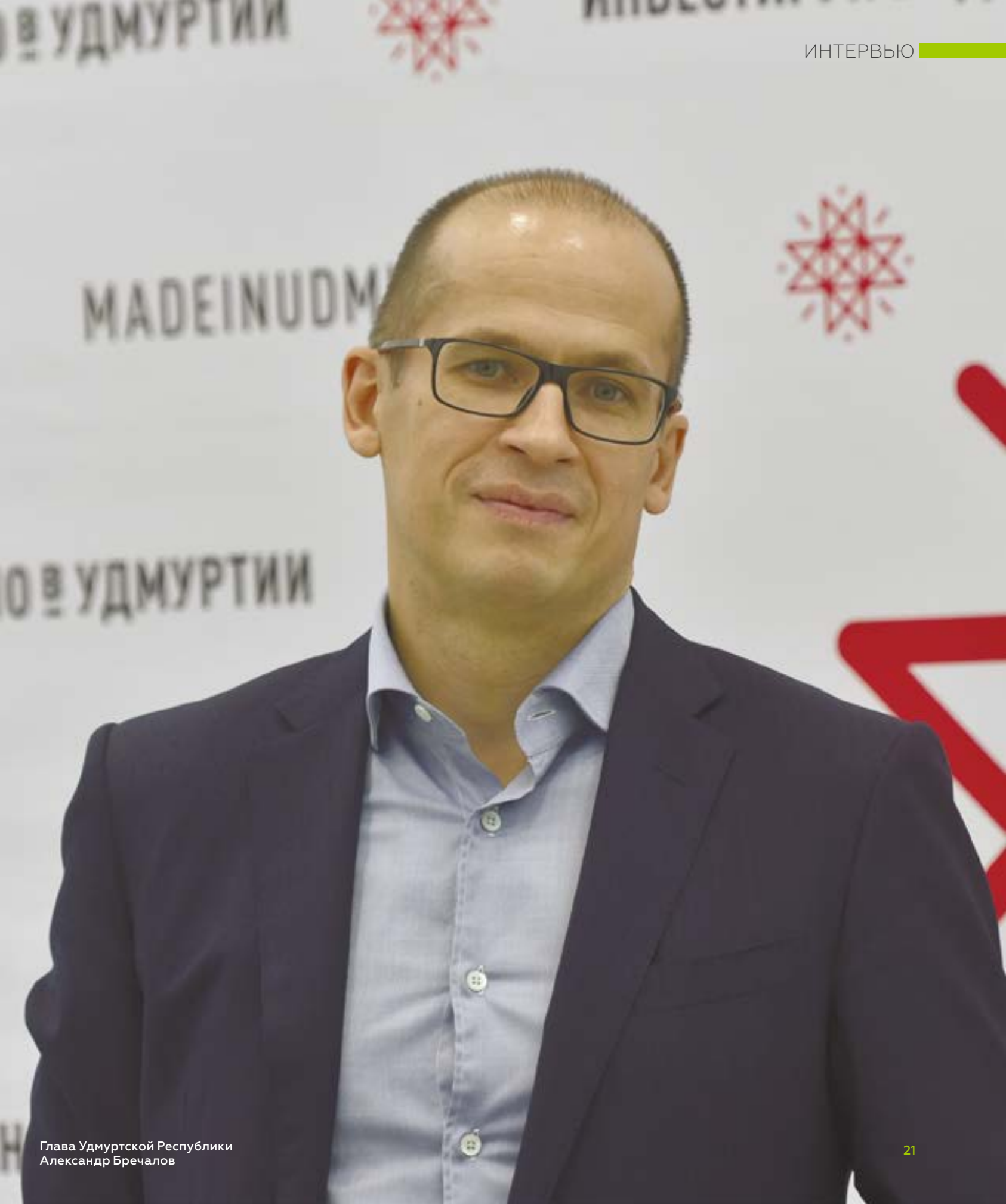
Глава Удмуртской Республики Александр Бречалов