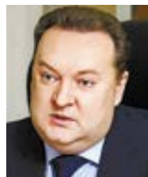
СЕРГЕЙ СУШКОВ , министр сельского хозяйства Челябинской области:

– ИНВЕСТИЦИИ ПРОДОЛЖАТ ПОСТУПАТЬ В АГРОКОМПЛЕКС.