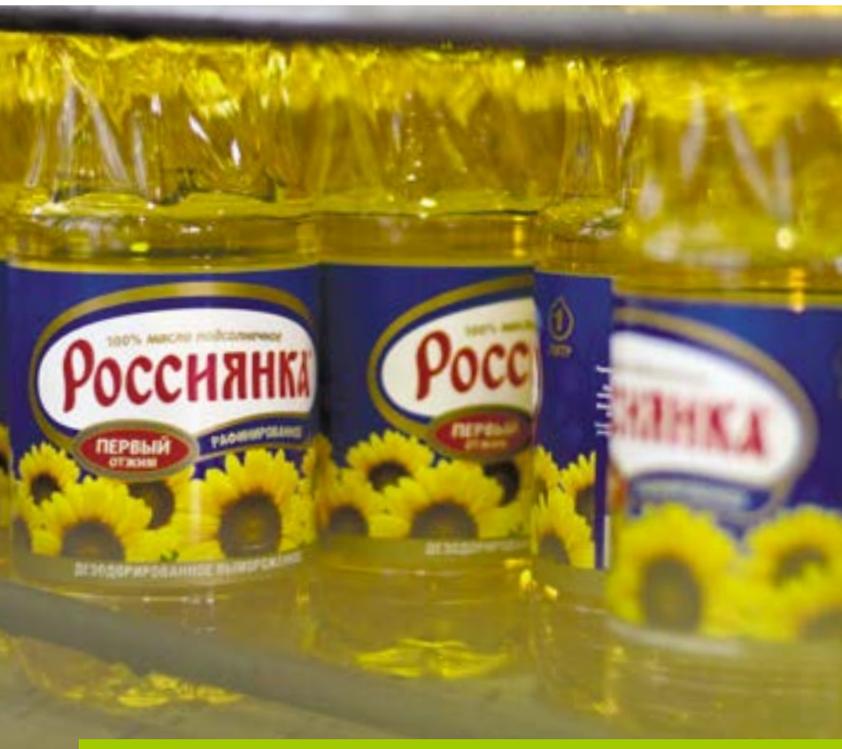
Объем переработки семян подсолнечника предприятиями холдинга «Солнечные продукты» за минувший сезон достиг 1 млн тонн

та по расширению присутствия в сегменте HoReCa, в том числе как поставщика сетям ресторанов быстрого питания. Речь идет не только о поставке соусов, объемы закупок которых ежегодно растут, но и других высококачественных продуктов на основе растительных масел, разрабатываемых для клиентов и совместно с ними.