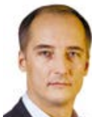
КОНСТАНТИН БАБКИН , президент ассоциации «Росспецмаш», президент промышленного союза «Новое Содружество»:

КАКОЕ БУДУЩЕЕ ОЖИДАЕТ АГРОПРОМЫШЛЕННЫЙ КОМПЛЕКС В РОССИЙСКИХ РЕГИОНАХ? ЕСТЬ ЛИ ШАНСЫ У РЕГИОНАЛЬНЫХ КОМПАНИЙ ПРИВЛЕЧЬ ОТЕЧЕСТВЕННЫЕ И ЗАРУБЕЖНЫЕ ИНВЕСТИЦИИ? ЧТО НЕОБХОДИМО ПРЕДПРИНИМАТЬ ВЛАСТИ, ЧТОБЫ ПОВЫСИТЬ ПРИВЛЕКАТЕЛЬНОСТЬ РЕГИОНАЛЬНОГО АПК? НА ЭТИ ВОПРОСЫ НАМ ОТВЕТИЛИ ПРЕДСТАВИТЕЛИ АГРОБИЗНЕСА, ОБЩЕСТВЕННЫХ ОРГАНИЗАЦИЙ И ГОСУДАРСТВЕННЫХ ОРГАНОВ.