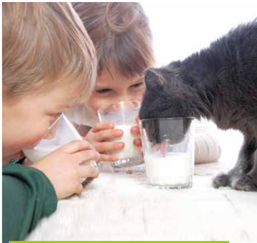
Алапаевский молочный комбинат массово выпускает серию фермерских продуктов «Домашнее», любимых потребителями

К 2020 ГОДУ ГРУППА КОМПАНИЙ «АГРОМИР» ЗА СЧЕТ РЕКОНСТРУКЦИИ ФЕРМ ДВУХ НЕРАБОТАЮЩИХ ХОЗЯЙСТВ В СВЕРДЛОВСКОЙ ОБЛАСТИ ПЛАНИРУЕТ УВЕЛИЧИТЬ ПОГОЛОВЬЕ МОЛОЧНОГО СТАДА ДО 10 000 ГОЛОВ.