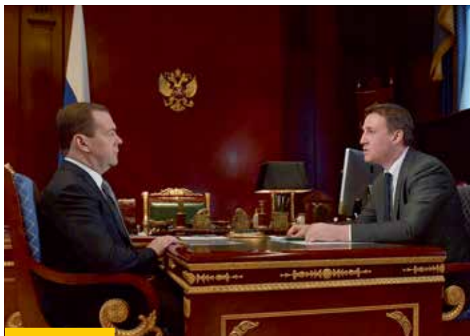
Председатель Правительства РФ Дмитрий Медведев отметил, что в значительной мере успехи сельхозпроизводителей связаны с тем, какие они используют финансовые инструменты

— Мы договорились о сохранении практически всех инструментов государственной поддержки, включая льготное кредитование для аграрных производителей, для села. Хотел бы, чтобы Россельхозбанк в этом смысле сохранял свою долю на рынке, оставался основным банком для кредитования и финансирования сезонных работ, то есть оперативной деятельности, а также для инвестиционных кредитов и тех производителей, которые относятся к категории малого и среднего бизнеса на селе. Это исключительно важно, — обратился к руководителю банка Дмитрий Медведев.