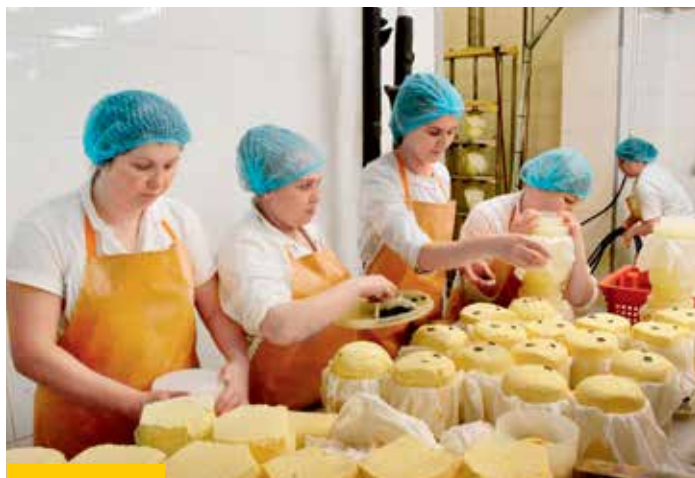
Качество мантуровских сыров обеспечивается высокой культурой производства и не менее высокими требованиями к сырью согласно ГОСТу

– Прошлый год показал востребованность нового механизма льготного кредитования АПК: сельхоз-производители Костромской области положительно отнеслись к новым мерам поддержки государства. Мантуровский сыродельный комбинат одним из первых предприятий региона воспользовался таким видом кредита и смог оценить его преимущества. Неудивительно, что и в этом году как активно и поступательно развивающееся предприятие он снова обратился к нам за льготным кредитом по ставке не выше 5 %. Впереди у завода много планов. Надеемся, что финансовые вливания Россельхозбанка при участии и поддержке государства дадут возможность их реализовать. А это значит, что сыры под маркой «Мантурово» приобретут не только европейские названия, но и европейский рынок сбыта.