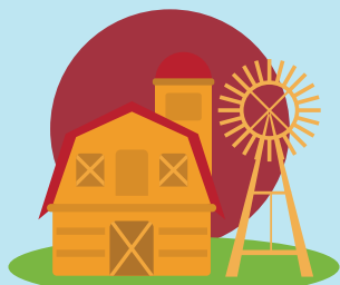
АПК УНИВЕРСАЛЬНЫЕ ПРОГРАММЫ