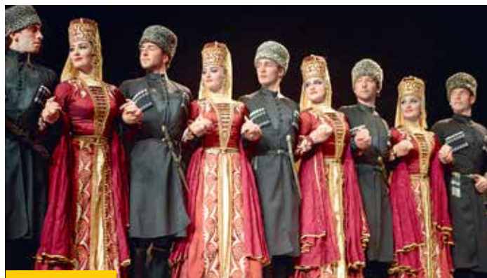
Государственный академический ансамбль Кабардино-Балкарской Республики «Кабардинка» – один из старейших коллективов народного танца Северного Кавказа

Приехать в КБР и не попробовать знаменитые хычины – значит не побывать здесь. Тончайшие пироги по старинным рецептам балкарской кухни готовят с самыми разными начинками: творогом, сыром, картошкой, мясом и даже со свежей мятой. А на десерт закажите популярный в республике древний напиток из кукурузной муки, меда и ячменного солода – бузу с вкуснейшими национальными лакомствами – воздушным лакумом и нежной халвой.