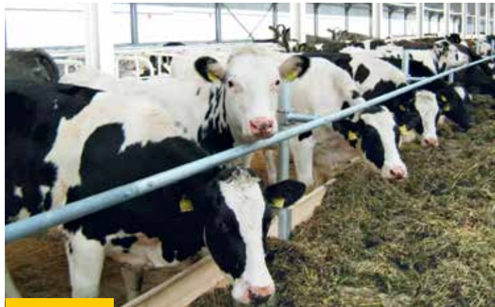
В хозяйстве активно развивают молочное животноводство: отремонтировали фермы, приобрели 200 голов КРС и сегодня лидируют по надоям в районе и области

ЕЖЕГОДНО АГРОФИРМА ЗАСАЖИВАЕТ ПОРЯДКА 1250 ГЕКТАРОВ ЗЕМЛИ. ОСНОВНЫМ НАПРАВЛЕНИЕМ ОСТАЕТСЯ ВЫРАЩИВАНИЕ ОВОЩЕЙ ОТКРЫТОГО ГРУНТА. ТАКЖЕ АКТИВНО РАЗВИВАЕТСЯ МОЛОЧНОЕ ЖИВОТНОВОДСТВО.