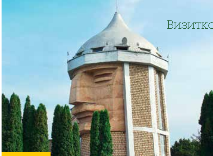
Символ Нальчика – необычное архитектурное сооружение в форме головы могучего богатыря – виден из любого уголка города: с 1967 года он стоит на горе Кизилровка, на высоте более 600 метров над уровнем моря, внутри «головы» – ресторан национальной кухни и смотровые площадки

Важной составляющей экономического потенциала республики является рекреационный комплекс, созданный на базе лечебных минеральных источников