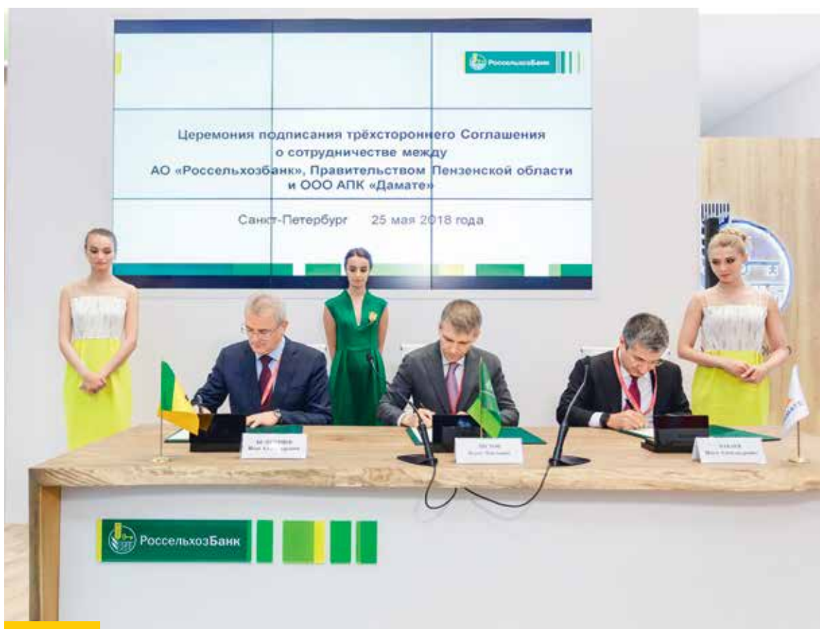
Трёхстороннее соглашение о строительстве завода глубокой переработки мяса индейки подписали руководители ГК «Дамате», Россельхозбанка и глава Пензенской области

П ервый день работы Петербургского международного экономического форума его участники посвятили обсуждению новых общенациональных целевых ориентиров, обозначенных Владимиром Путиным в указе «О национальных целях и стратегических задачах развития РФ на период до 2024 года». В рамках этой темы говорили и о социально-экономическом развитии регионов: необходимости наращивать инвестиции в АПК и расширять экспортный потенциал сельского хозяйства России. К 2024 году годовой объем экспорта сельхозпродукции должен составлять 45 миллиардов долларов в год – именно такая задача закреплена в поручении Президента России Правительству РФ. Готовность объединяться для достижения этих целей продемонстрировали представители государства, бизнеса и финансовых институтов, подписав в этот день несколько важных для отрасли инвестиционных соглашений.