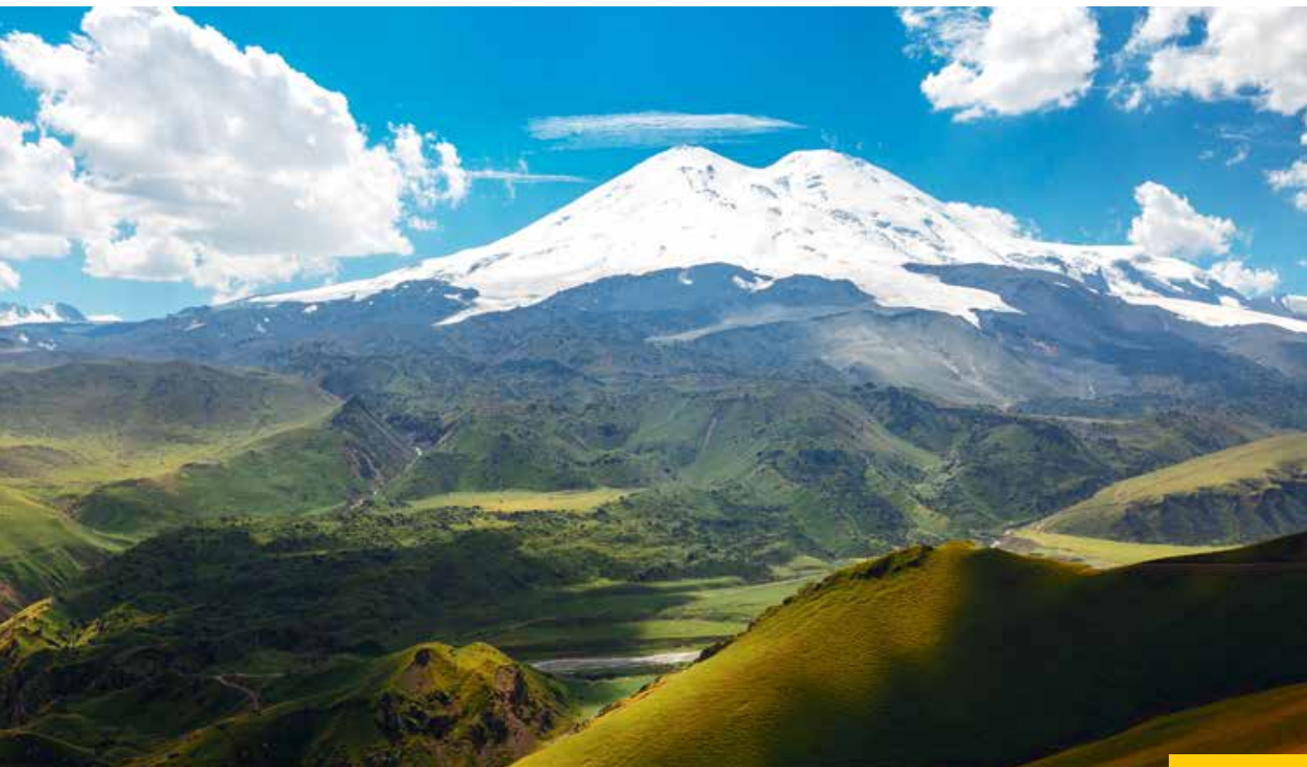
Двуглавый Эльбрус – это Мекка горнолыжников, альпинистов и туристов. На его склонах снег лежит почти 12 месяцев, и кататься можно круглый год. Заснеженные вершины Эльбруса украшают герб и флаг КБР

СРЕДИ ЗНАМЕНИТЫХ УРОЖЕНЦЕВ РЕСПУБЛИКИ – ФЛОТОВОДЕЦ, АДМИРАЛ АРСЕНИЙ ГОЛОВКО, НАРОДНЫЙ ПОЭТ КАССЕР, ЛАУРЕАТ ЛЕНИНСКОЙ И ГОСУДАРСТВЕННЫХ ПРЕМИЙ СССР И РСФСР КАЙСЫН КУЛИЕВ, НАРОДНЫЙ АРТИСТ СССР, ЛАУРЕАТ ГОСУДАРСТВЕННЫХ ПРЕМИЙ СССР, РСФСР И РФ ДИРИЖЕР ЮРИЙ ТЕМИРКАНОВ И ОЛИМПИЙСКИЙ ЧЕМПИОН, ЧЕМПИОН ЕВРОПЫ И РОССИИ ПО ДЗЮДО БЕСЛАН МУДРАНОВ.