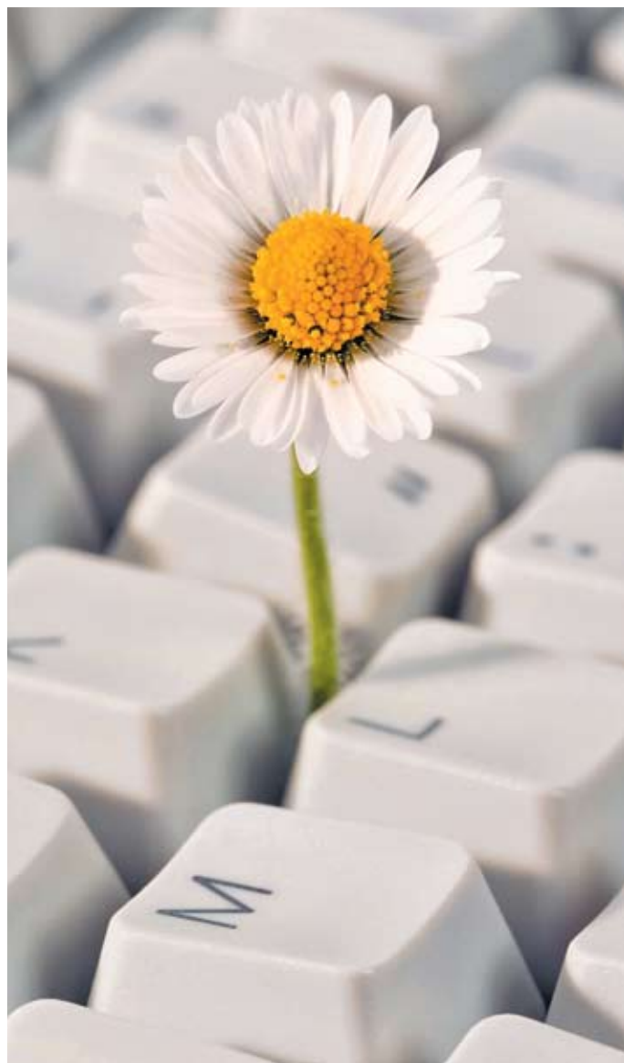
А. ЛАМЫ / Фото ИТАР-ТАСС