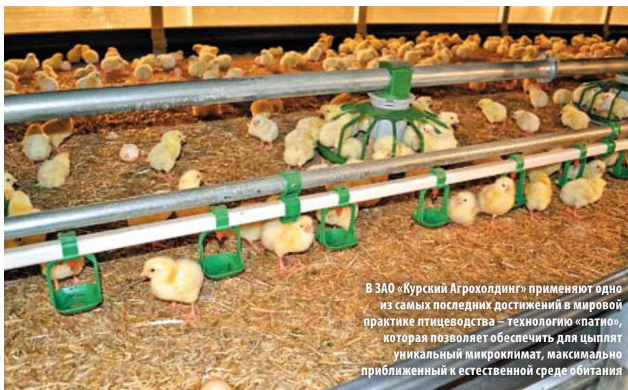
В ЗАО «Курский Агрохолдинг» применяют одно из самых последних достижений в мировой практике птицеводства – технологию «патии», которая позволяет обеспечить для цыплят уникальный микроклимат, максимально приближенный к естественной среде обитания

При помощи Курской областной администрации и Россельхозбанка успешно реализован крупный социально ориентированный проект ЗАО «Курский Агрохолдинг» – это современный птицекомплекс мощностью более 100 000 тонн продукции в год. Во время визита на предприятие глава региона Александр Михайлов отметил, что этот проект не имеет аналогов и является ярчайшим примером для всех, кто готов идти по инновационному пути развития аграрного производства и осознает важность комплексного развития сельских территорий.