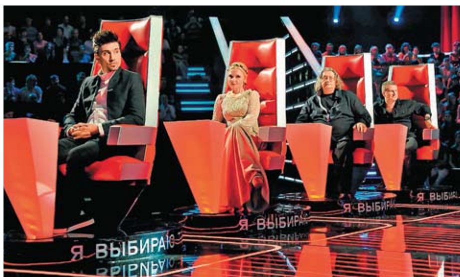
В популярном вокальном телешоу «Голос», выходящем на Первом канале, Пелагея выступает в новом для себя амплуа – в качестве тренера-наставника – и блестяще справляется с этой ролью

видеть. Можно очень много скидывать на устаревшие бюрократические институты, но дело и в нашем менталитете. Если мы будем думать о том, какую информацию транслируем окружающим нас людям, и сами будем ставить фильтры на негатив, всем будет жить гораздо лучше.