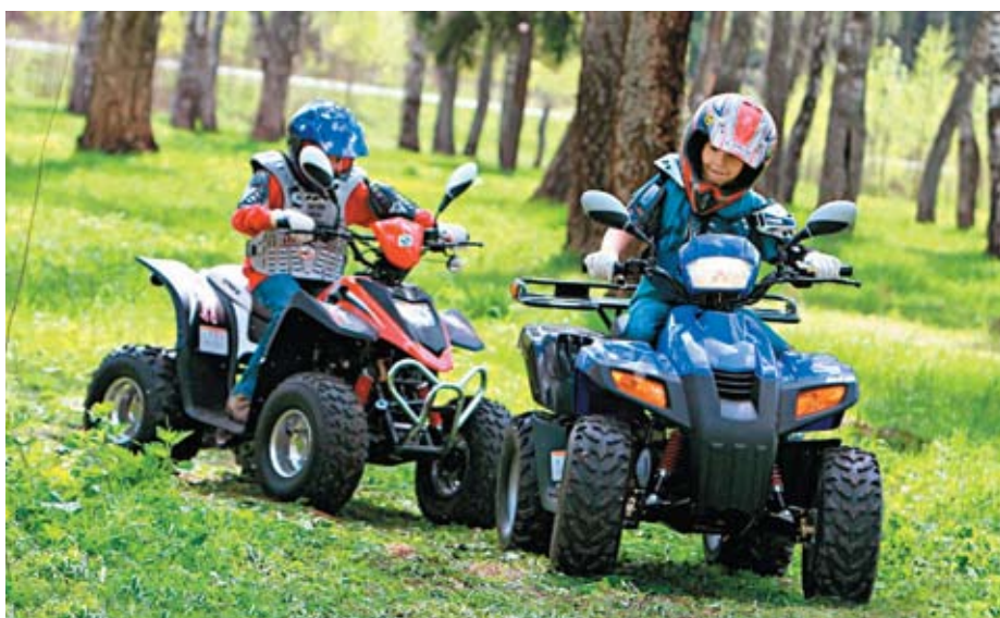
В лесной заимке любители экологического туризма и активных видов отдыха могут не только насладиться удивительной сахалинской природой, но и принять участие в пеших походах и прокатиться на квадроциклах по живописной местности

База отдыха «Елочки» открыла свои двери совсем недавно, но у нее уже появились постоянные клиенты.