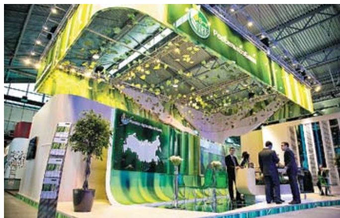
В информационно-выставочном павильоне Россельхозбанка участники и гости престижного международного бизнес-форума могли познакомиться со всем спектром предоставляемых банковских продуктов и услуг

– Россельхозбанк ежегодно выступает не только активным участником форума, но и его партнером. Это неслучайно, – говорит Председатель Правления банка Дмитрий Патрушев. – Отечественный АПК обладает уникальными возможностями для роста. В то же время для его дальнейшего развития необходимо снять существующие инфраструктурные ограничения, в том числе связанные с отсутствием современных мощностей по