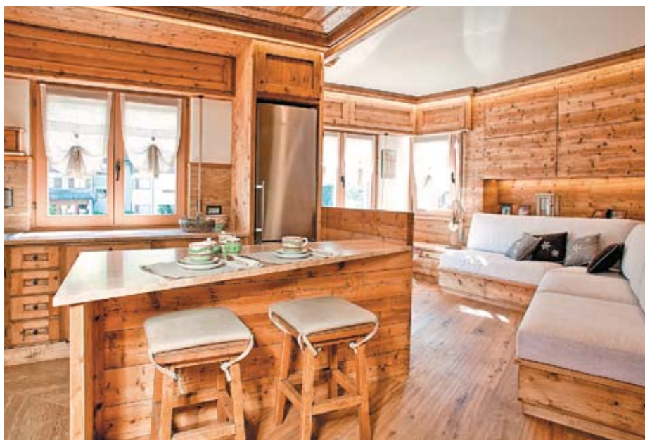
Даже с небольшим опытом столярного ремесла можно самостоятельно сделать из натурального дерева оригинальные гарнитуры, которые станут предметом гордости хозяев и восхищения гостей

Бревенчатый гарнитур можно немного обжечь паяльной лампой или покрыть морилкой, закрепив полученный эффект восковой мастикой или лаком. Для того чтобы стол и табуреты служили дольше, желательно применять специальные составы, защищающие древесину от погодных условий. Использование пропитки и антисептика избавит конструкцию от плесени и насекомых. Изделия из досок легко украсить с помощью трафаретов. Это придаст им изящный вид или