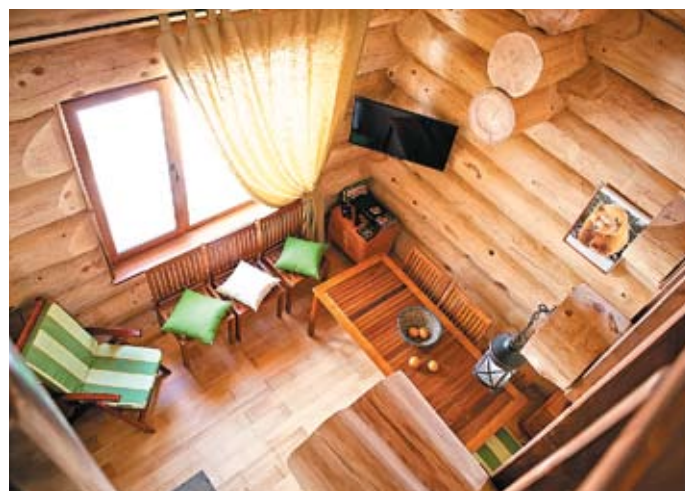
Гости могут разместиться в бревенчатых избах, где созданы все необходимые условия для комфортного проживания