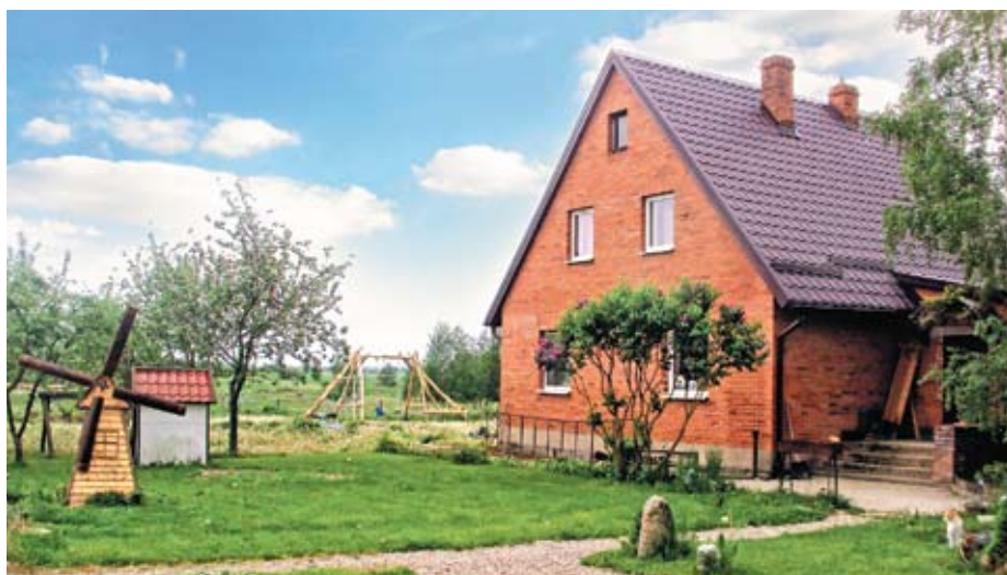
На месте заросшего поля рачительные хозяева разбили прекрасный сад и выстроили красивые домики, в которых всегда царит радушие, согласие и взаимовыручка

– Мы с сестрой – не разлей вода. Всегда вместе и все делаем сообща: растим внуков, отдыхаем и работаем. И смело идем вперед. В планах – увеличение угодий, дальнейшее развитие хозяйства и выход на новые рынки сбыта. Сегодня мы реализуем свою продукцию