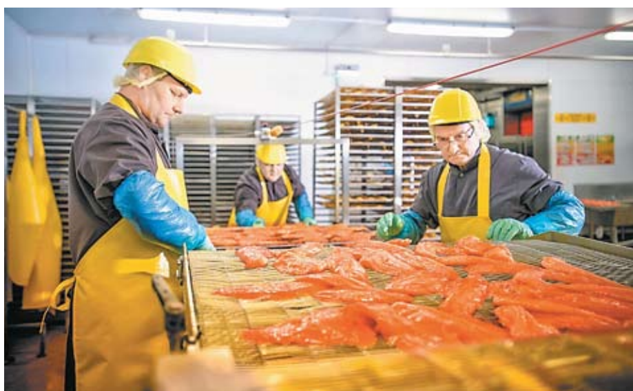
Супруги закупают у местных поставщиков свежую рыбу лососевых пород и производят в собственном цехе копченую рыбопродукцию, которая пользуется большим спросом по всей России

Особенности островного климата, характеризующегося непредсказуемостью природы, подтолкнули фермеров к созданию еще одного направления бизнеса, причем в нашем крае мало развитого, но очень перспективного. Банк поддержал их начинание. Супруги на кредитные средства построили два комфортных гостевых дома с каминами и сегодня принимают у себя как жителей, так и гостей острова. В нашей «копилке отношений» уже третий кредит и, думается, не последний. В планах сельских хозяев – развитие своей базы и расширение спектра услуг. Сейчас они строят для туристов русскую баню на дровах.