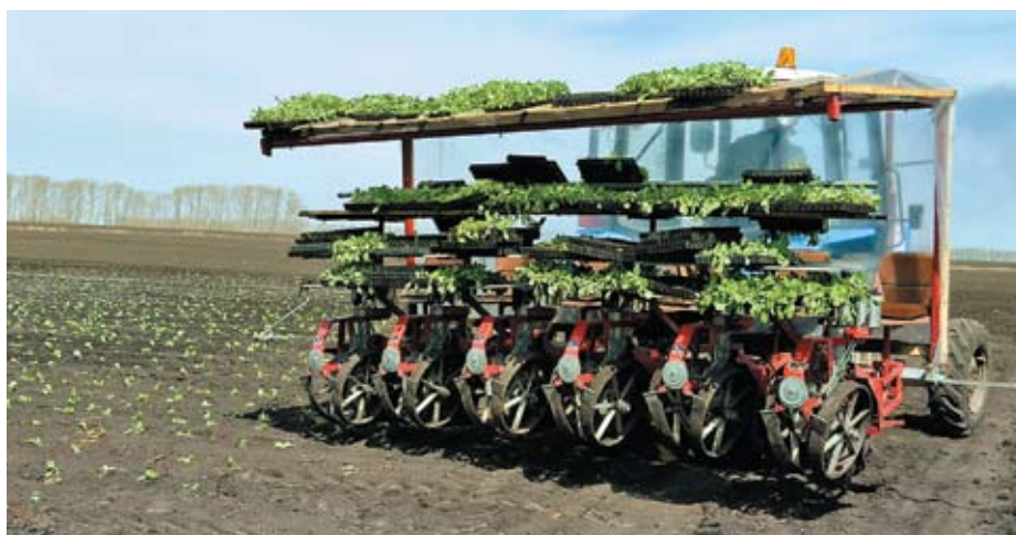
В этом году в агрофирме «Лаишевские овощи» увеличили посевные площади капусты и зерна, изменили технологию посадки и ожидают роста урожая на 40%

кам областной социальной программы «Овощные сертификаты». Она помогает обеспечить жителей региона местной продукцией в период сбора урожая по ценам производителя. Сертификат дает право на приобретение 200 килограммов отборных плодов за 2000 рублей. Как фирменный знак к обязательному набору, который полагается по сертификату, агрофирма «Лаишевские овощи» дарит сахарный арбуз, выращенный на родных полях.