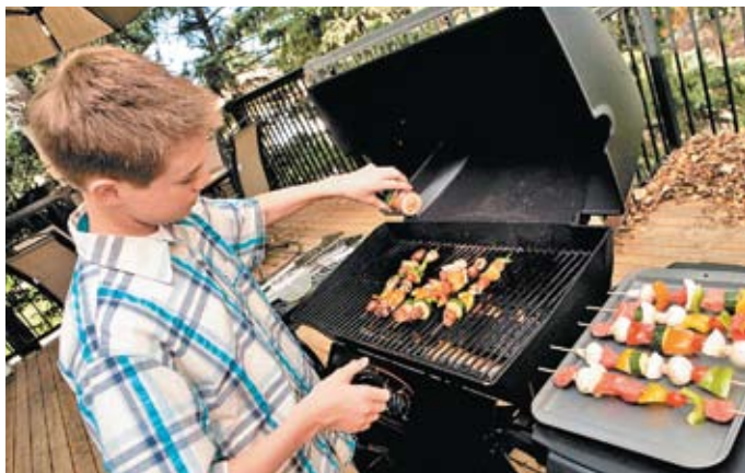
К услугам гостей базы отдыха «Елочки» мангал для приготовления на свежем воздухе мясных и рыбных блюд из местных экологически чистых продуктов