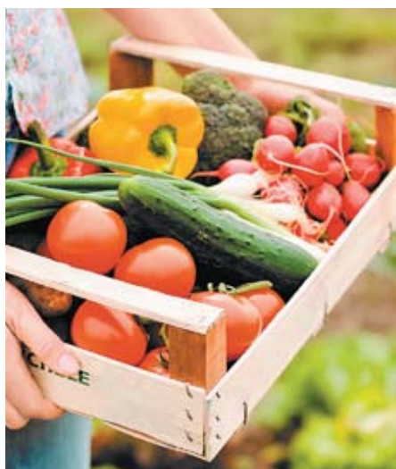
Овощи и зелень, выращенные на своих полях, у местного населения пользуются большим спросом, нежели привозные

Спрос на местные арбузы оказался неожиданно высоким. Большую часть