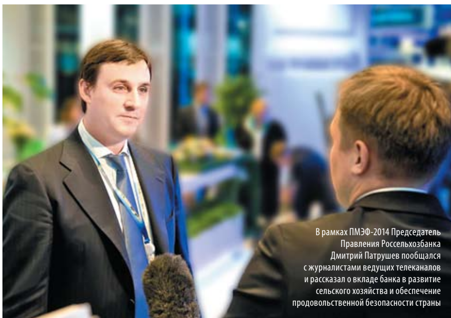
В рамках ПМЭФ-2014 Председатель Правления Россельхозбанка Дмитрий Патрушев пообщался с журналистами ведущих телеканалов и рассказал о вкладе банка в развитие сельского хозяйства и обеспечение продовольственной безопасности страны