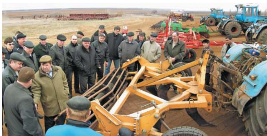
В хозяйствах ассоциации, как и было принято прежде, проводят проверку сельскохозяйственной техники перед началом весенней посевной кампании

Результатом партнерства стали высококачественные сорта нута, которые внесены в госреестр и пользуются заслуженным спросом.